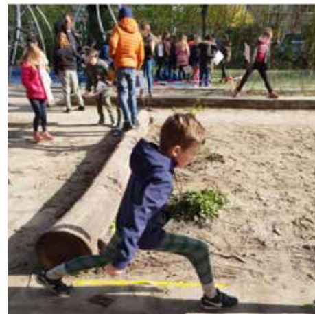
Oppervlakte en omtrek meten, meten is weten!