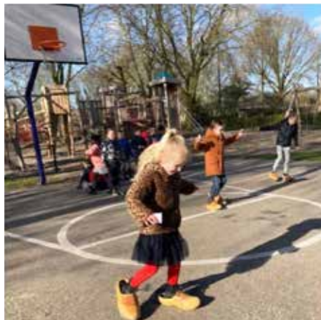
Rekenen op klompen!

lessen te geven. Het zijn lessen waar leerlingen zelf dingen uitzoeken, veel samenwerken en hun lichaam en zintuigen gebruiken tijdens het leren. Bewegen tijdens het leren is niet alleen goed voor de lichamelijke gezondheid van kinderen, maar