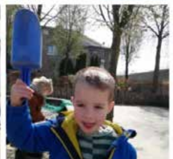
op zoek naar kleuren, bij de kleuters!