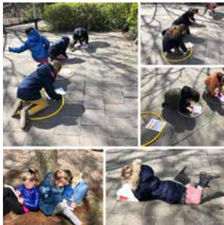
Leesestafette, en lekker buiten lezen

De kleuters gingen op zoek naar kleuren, er werd gerekend op